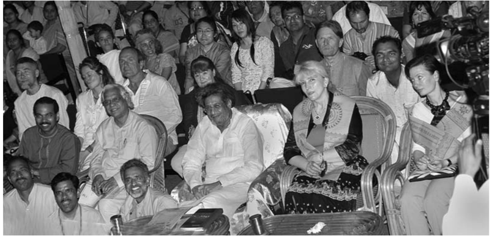
Индийский Фестиваль йоги, культуры и духовности по праву считается международным — в нем участвуют гости со всех уголков планеты