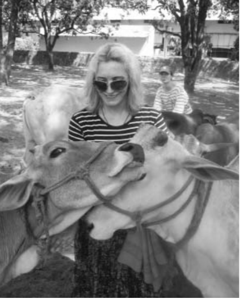
На территории Университета священные для Индии животные — коровы — чувствуют себя полноправными хозяевами